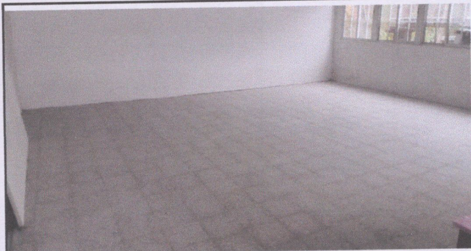
Foto1: Reparación de piso y construcción de pared